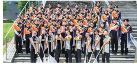
大分東明高等学校吹奏楽部・バントワリング部

東明高校吹奏楽部&バントワリング部と社会人ビッグバンドのミッドジャズオーケストラのスペシャルコラボ。OPAM10周年を祝って、商店街を楽しい音楽で彩ります。