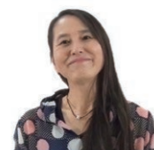
ミニチュア工房「まるめっ小」いもこ ミニチュア作品の展示・ワークショップ