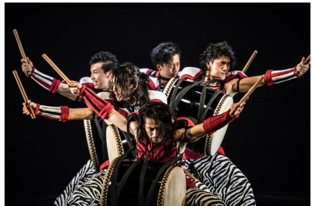
DRUM TAO『RHYTHM of TRIBE～時空旅行記～』(2018年)