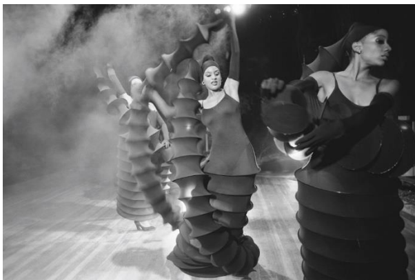
ファッションショー in キューバ(1996年)