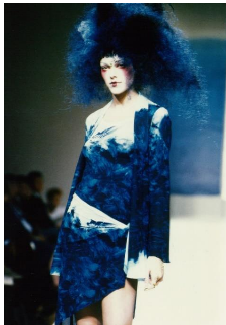
パリコレクション 1998SS