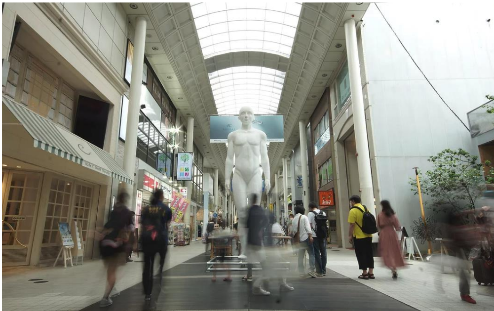
過去の展示の様子: 「Flags in 上通」2021年 熊本市上通アーケード内オモケンパーク前付近

4月29日(金・祝)～5月1日(日)に JR 大分駅から OPAM までを結ぶ商店街(セントポルタ中央町・ガレリア竹町)の中間地点である「竹町ドーム広場」に巨大フィギュアが登場します。