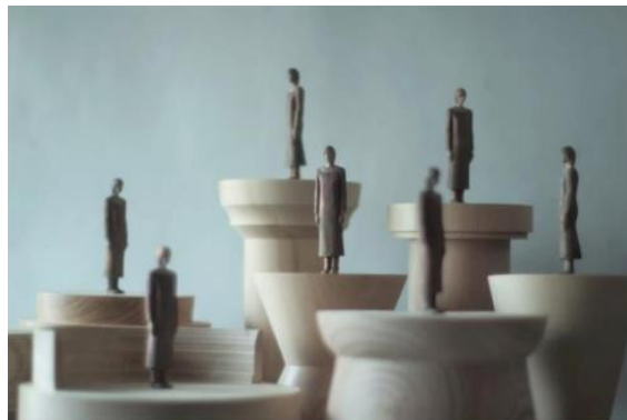
左:オレクトロニカ 右:「もう一つの風景」2020/GALLERIA MIDO BARU,別府