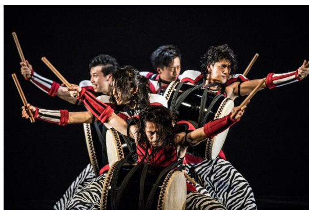
DRUM TAO『RHYTHM of TRIBE～時空旅行記～』(2018年)