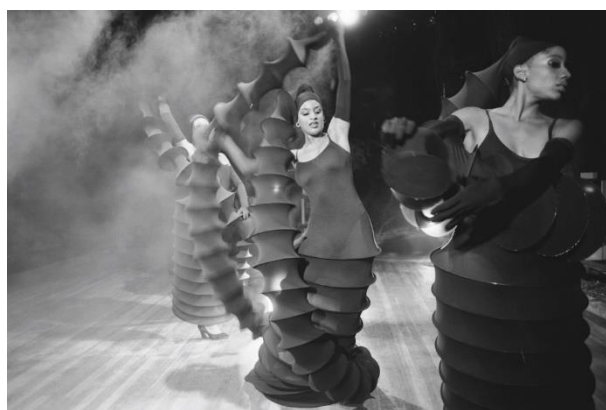
ファッションショー in キューバ(1996年)