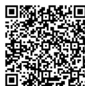
「みつをになったつもりで」HP