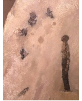
《鳥と青年》1959年 大分県立美術館

《鳥と青年》は、その直後に制作された作品です。飛び立つ鳥を見上げる青年の姿には、絶望的な状況の中で、生と死を見つめる画家の心境が映し出されているかのようです。糸園は、手術をすると絵筆を握れるか不明と言われ、周囲の反対を押し切って退院しました。