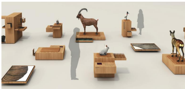
4. 巡回展キットイメージ