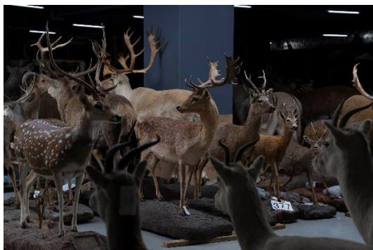
1. 自然史標本棟 動物剥製 (写真：©Gottingham)