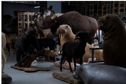
2. 自然史標本棟 動物剥製