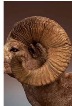
3. 自然史標本棟 動物剥製