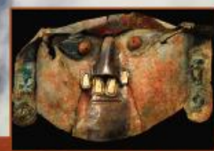
(金の合金製のシカン神の仮面)