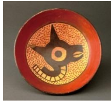
《リヤマが描かれた土器》 ディタクティコアントニーニ博物館所蔵

地上絵で有名なナスカだが、土器にもすぐれて芸術的なものが多い。適度に抽象化されているこの土器の絵もその一つ。