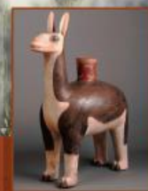
(リヤマ毛かたどった土器)