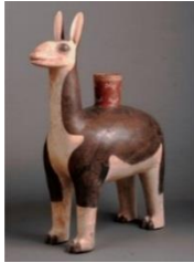
《リヤマをかたどった土器》 ペルー文化省・国立考古学人類学歴史博物館所蔵

ラクダ科のリヤマは運搬・織物のための採毛・食肉などの用途でアンデスには欠かせない家畜だ。この高炉の高さは約70cmもある大きなもの。