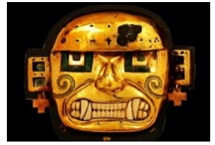
《黄金製の神像》 ペルー文化省・国立博物館所蔵

モチェ文化はペルー北海岸で繁栄したユニークな土器と華麗な黄金製品で有名な文化。牙が生えているのはアンデス文明の神の特徴の一つ。