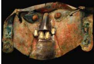
《金の合金製のシカン神の仮面》 ペルー文化省・国立シカン博物館所蔵

アンデスの多神教の風土の中で、シカンではこの仮面のような「アーモンド・アイ」をした「一神教的な」神が頻出する。