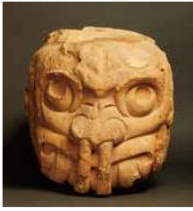
《差し込み用の突起付きの石の頭》 ペルー文化省・国立チャビン博物館所蔵

チャビン・デ・ワンタル神殿の壁に差し込まれていた石の頭像。神への変身の過程を描いている。