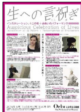
15. ホームページ画像