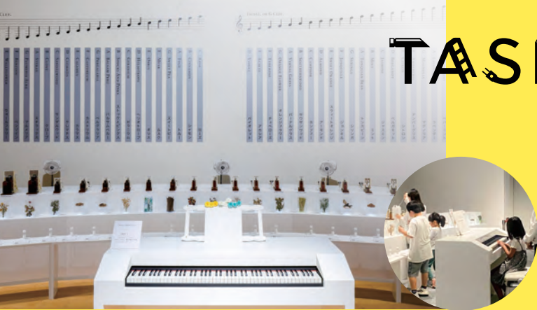
パフューマリー・オルガン