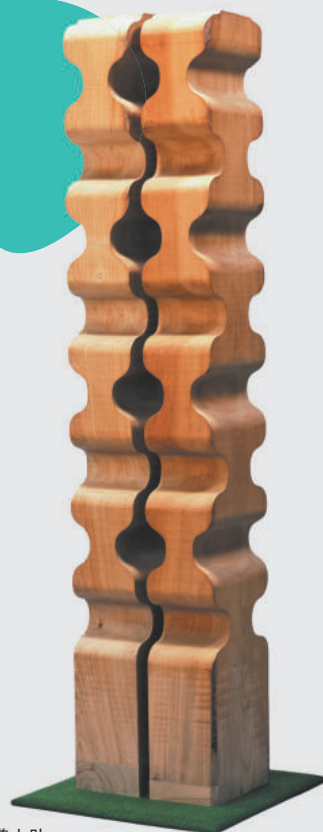
宮崎準之助 《立つものの様態》1976年