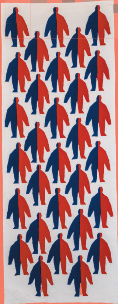
袖木沙弥郎《人、人、人》2001年