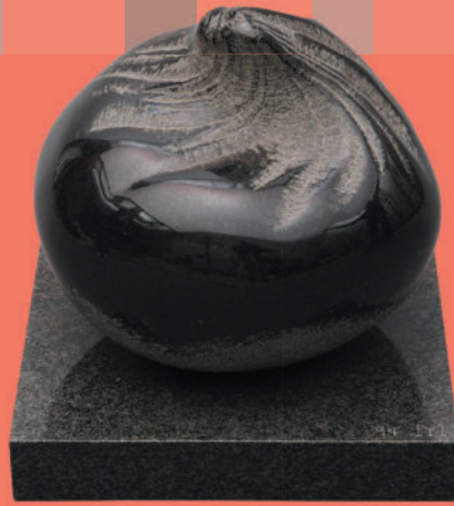
吉村益信《なぜか茶巾しぼり》1994年