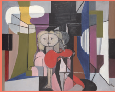
佐藤敬《子供の時間》1951年