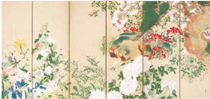
《四季花木図屏風》(右隻) 渡辺始興 江戸時代 重要美術品 (展示期間:2/9(金)~3/3(日))

即翁の愛蔵印「與衆愛玩」の言葉には、「蒐集品を独占するのではなく、多くの人と共に楽しもう」という想いが込められています。本展覧会は、施設改築工事のため休館している富山記念館の「與衆愛玩」という即翁の理想を分かち合うために、九州の地で初めて開催されます。厳選された約70件の名品を通して、即翁の審美眼と美意識にふれ、彼が愛した茶の湯をはじめとした日本文化を末永く伝えていきたいという思いを共有する機会となれば幸いです。