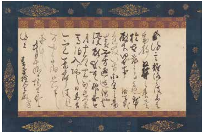
《離洛帖》藤原佐理 平安時代 国宝 (展示期間:2/9(金)~3/3(日))

富山記念館は、昭和39年(1964)、株式会社荏原製作所の創業者である富山一清(1881-1971)によって東京港区・白金台の閑静な地に開館しました。事業のかたわら、即翁と号して能楽と茶の湯を嗜む数寄者でもあった富山一清は、長年にわたり熱心に美術品の蒐集に努めました。そのコレクションは、茶道具を中心とする日本、中国、朝鮮の古美術品で、国宝6件、重要文化財33件を含む約1,300件に及びます。