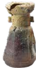
《伊賀花入 銘からたち》 桃山時代 重要文化財

大分県立美術館、iichiko総合文化センター 1Fインフォメーション、大分合同新聞本社・プレスセンター、OBS大分放送、トキハ会館3Fプレイガイド、エトウ南海堂、大分市府内五番街商店街 振興組合、NPO法人大分県芸術振、大分県職員消費生活協同組合、チケットぴあ(セブンイレブン各店)(Pコード:686-493)、ローソンチケット(ローソン各店)(Lコード:83916)