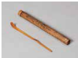
《竹茶杓 銘落曇》千利休 桃山時代

会期 2024年2月9日(金)~3月26日(火) 〈3月4日(月)は展示替えのため休展〉