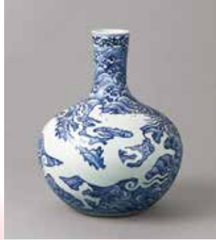
《青花龍瀟文天球瓶》中国・明時代 重要文化財