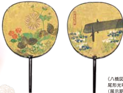
《八橋図・秋草図団扇》 尾形光琳 江戸時代 (展示期間:3/5(火)~3/26(火))