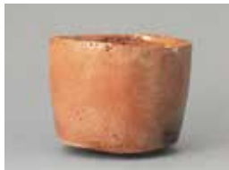
《赤楽茶碗 銘李白》本阿弥光悦 江戸時代