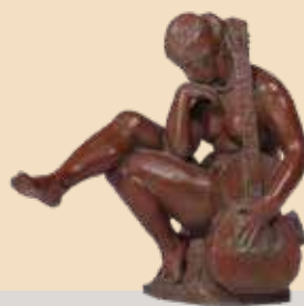
日名子実三《ギターを持てる女》(1927年)

OPAMグローバルネットワークによる機能強化事業 地域美術館を核とする地域の魅力再発見・発信事業