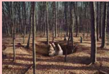
佐藤雅晴《Little big》(2009年、個人蔵)

昨年度、大分県立美術館と水戸芸術館現代美術ギャラリーで回顧展「佐藤雅晴 尾行-存在の不在/不在の存在」が開催された臼杵市出身の佐藤雅晴の作品を展示します。