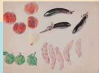
福田平八郎《桃、茄子、薩摩芋、カボス》(1953年)