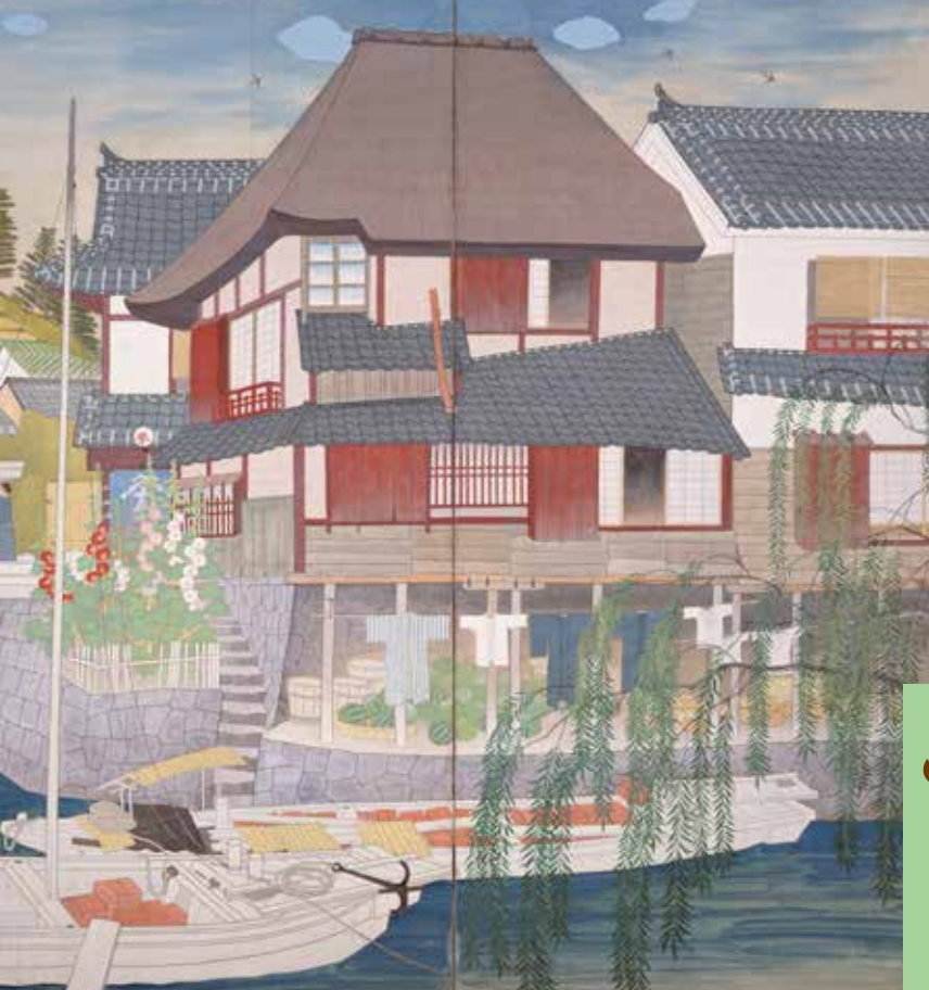
首藤雨郊《港町風景》(1937年)