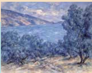
江藤純平《オリーブと海》(1978年)