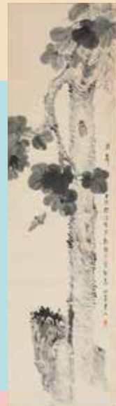
白須心華 《怪石叢篋図》 (大正期頃)