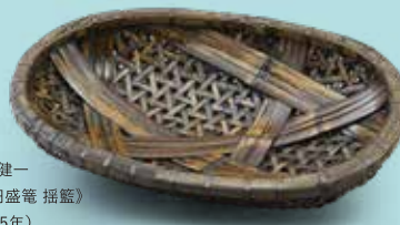
毛利健一 《楕円盛籠 揺籃》 (1995年)