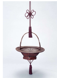
早川尚古齋(四世)《釣花籃》1931(昭和6)年 大分県立美術館

2022年 9月16日(金) - 11月13日(日) ○休展日: 10月12日(水)