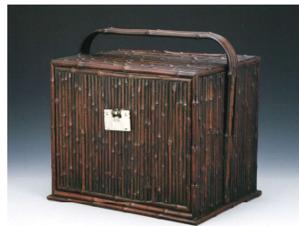
《紫竹器局》大正～昭和期 此君亭コレクション

2022年 7月15日(金) - 9月12日(月) ○休展日: 8月10日(水)