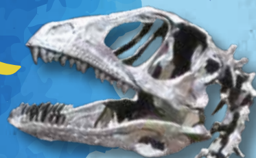
デイノニクス (肉食恐竜)