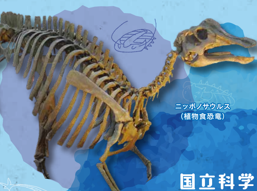
ニッポノサウルス (植物食恐竜)