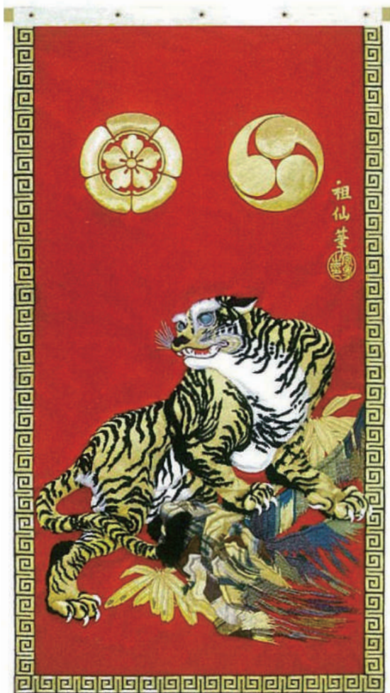
大和町見送幕「岩に虎」(平成19年度復元新調)

他に日田祇園山鉾の写真・パンフレット・ポスターや、日田市の日本遺産に関する展示も実施しています。是非、ご鑑賞ください。