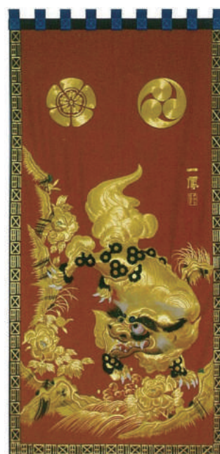
港町見送幕「牡丹に唐獅子」 (平成21年度復元新調)