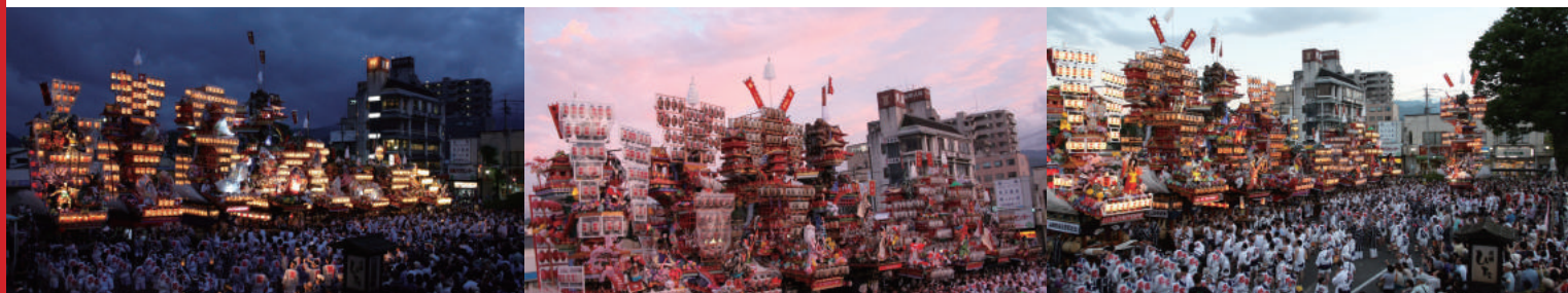
(日田祇園山鉾集団顔見世)