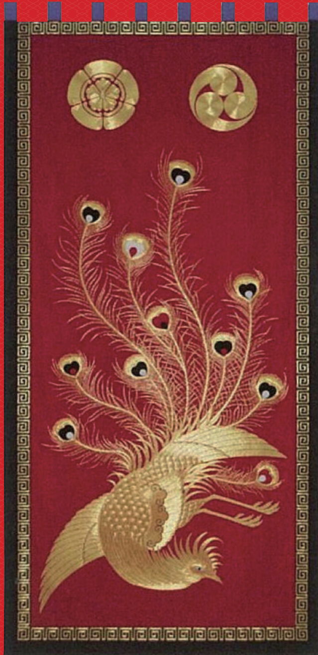
豆田下町見送幕「鳳凰」 (平成26年度復元新調)

国の重要無形民俗文化財である「日田祇園の曳山行事」が、ユネスコの無形文化遺産に「山・鉾・屋台行事」として登録されたことを記念し、新年を迎える祝賀の特別展示を開催します。