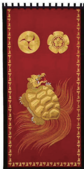
中城町見送幕「玄武」 (平成27年度復元新調)

飾りつけが山鉾の前面の華であるのに対して、背面の華が「見送幕」です。幕は高さ3m、幅1.5mもあり、緋羅紗地に金糸を用いて虎や鳳凰などを刺繍した豪華絢爛なものです。