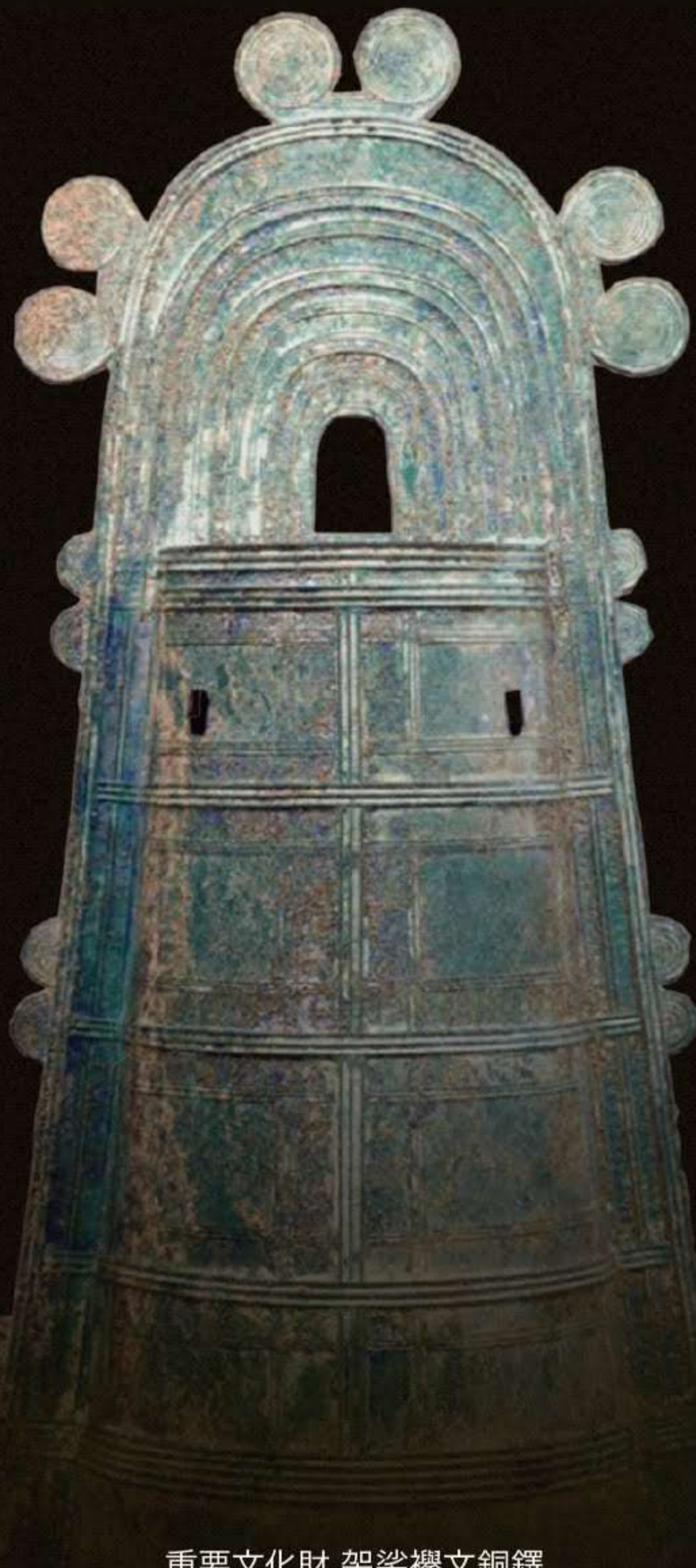
重要文化財 袈裟襴文銅鐸 (滋賀県野洲市大岩山出土) 東京国立博物館所蔵

1956年神奈川県相模原市生まれ。國學院大学大学院文学研究科日本史学専攻博士課程後期単位を取得。1985年、東京国立博物館(東博)に入り、東博の学芸部考古課先史室長や事業部教育普及課長、九州国立博物館学芸部長、東博学芸企画部長などを歴任。東博副館長を経て、2021年4月、奈良国立博物館長に就任。日本考古学が専門で、日本の青銅器文化の研究などを行っている。日本ユネスコ国内委員会委員、ICOM日本委員会理事として、文化財保護や博物館活動にも尽力している。2019年6月から2021年3月までは、大分県立美術館の特別顧問も務めた。